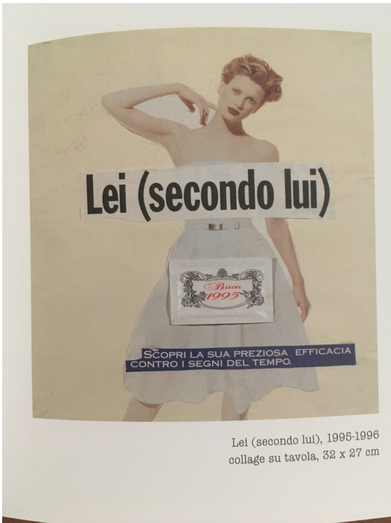
Lei (secondo lui), 1995-1996 collage su tavola, 32 x 27 cm