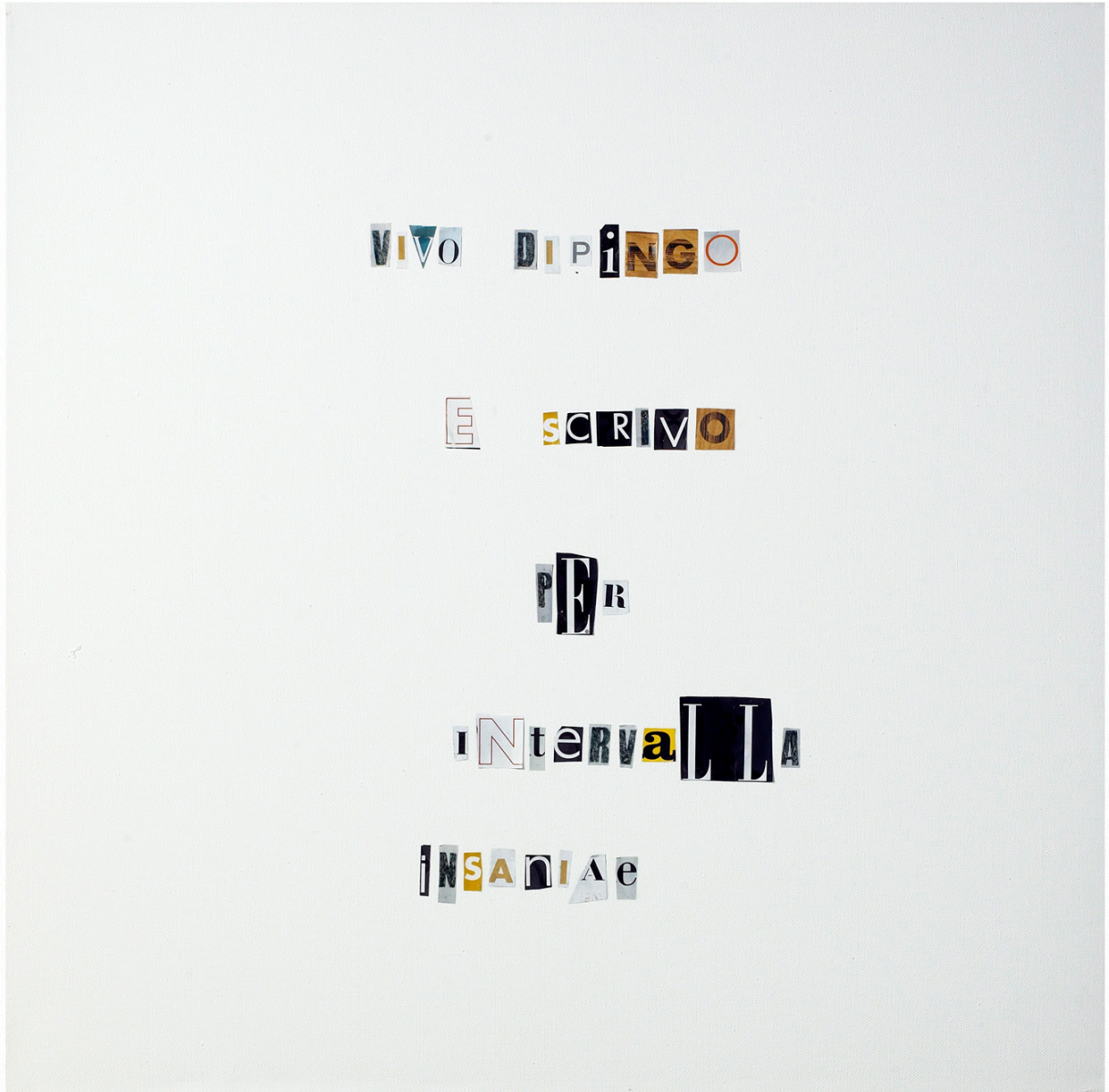
“Vivo,dipingo e scrivo ” 2006